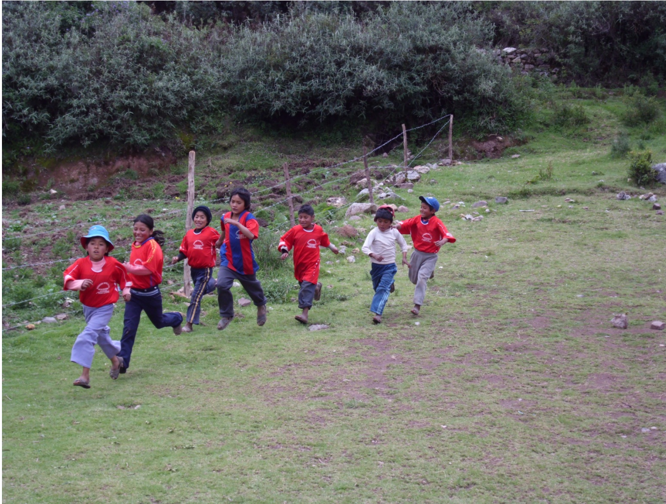
Los niños del tercer grado realizando una carrera en el área de educación física.