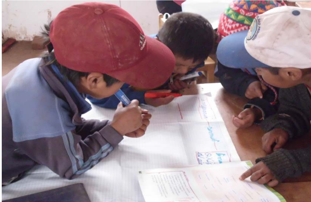
Los niños del tercer grado trabajando en grupo, dando sus opiniones y elaborando un esquema para luego ser expuesta por ellos mismos hacia sus compañeros.