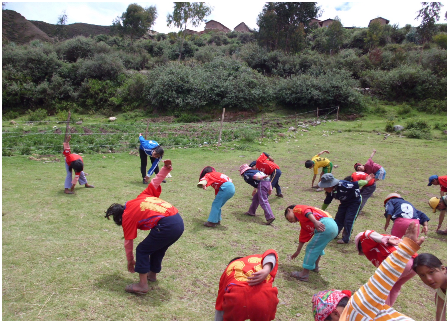
Estamos realizando ejercicios conjuntamente con la docente.