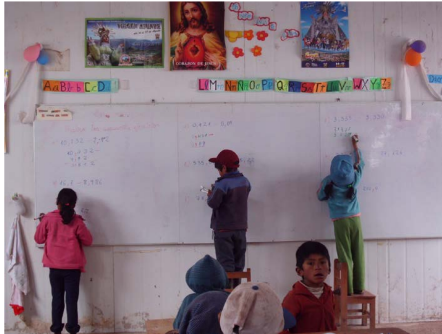
Los niños resuelven sumas de números decimales en la pizarra y el ganador se lleva un premio.