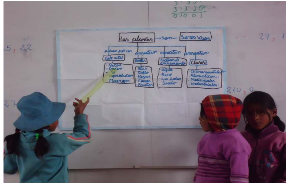
Las niñas exponiendo sobre el tema de las plantas hacia sus compañeros para luego intercambiar opiniones