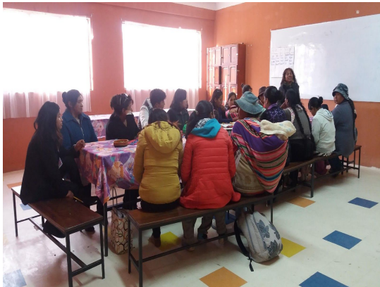
Espacios de encuentro familiar y socio culturales con MPF's