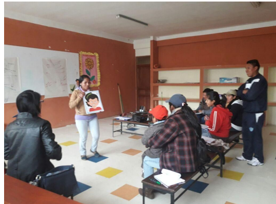
Capacitación al personal voluntario y practicantes