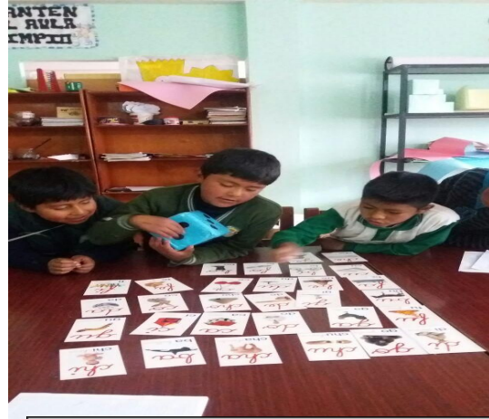
Trabajo de apoyo pedagógico